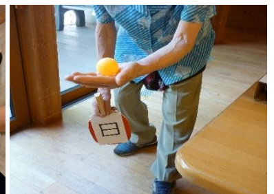
東京オリンピックでは皆様と一緒に熱の入った応援をしました🇯🇵