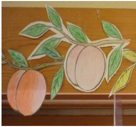
染めた桃も美味しそう