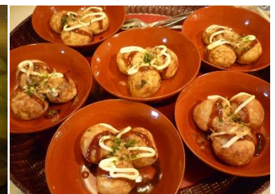
ぶなの畑でミウガを収穫！冷汁や縁日メニューで夏を楽しみました♪